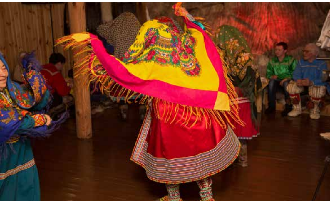
Dans i folkdräkt.