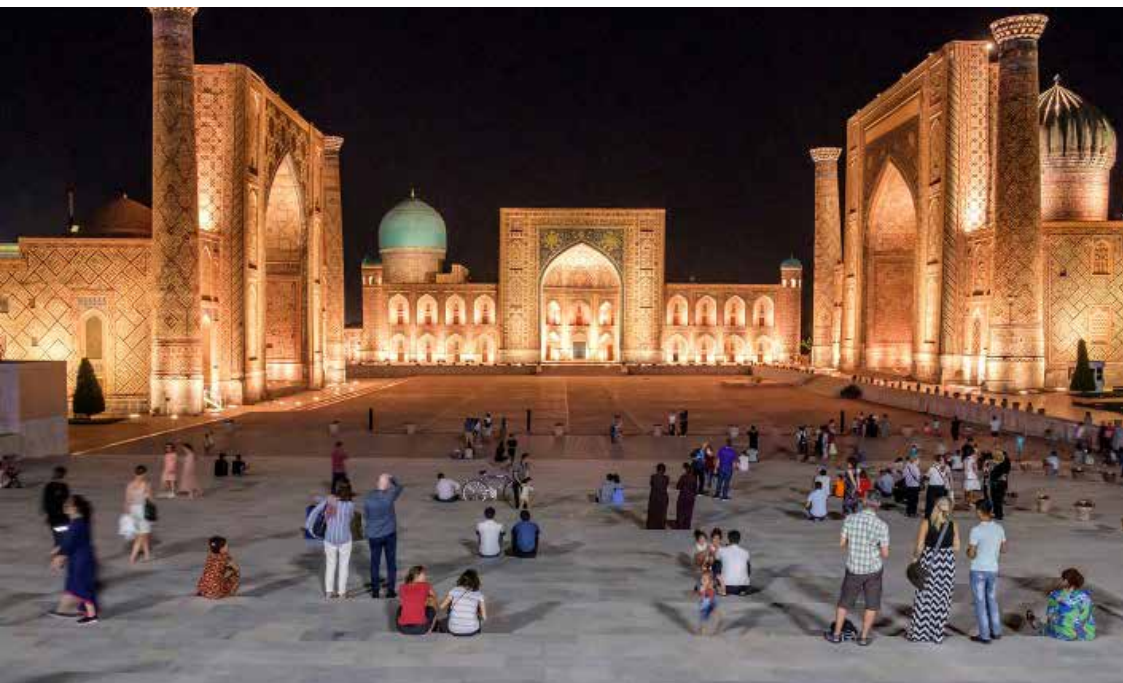
Människor samlas på kvällen i Samarkand.